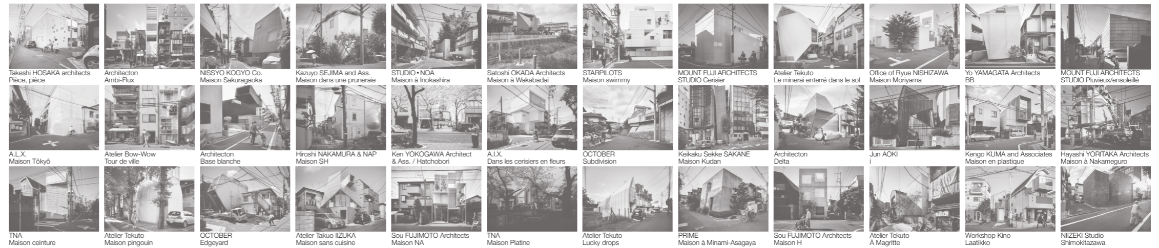
Takeshi HOSAKA architects Pièce, pièce Architecton Ambi-Flux NISSYO KOGYO Co. Maison Sakuragaoka Kazuo SEJIMA and Ass. Maison dans une pruneraie STUDIO+NOA Maison à Inokashira Satoshi OKADA Architects Maison à Wakabadaï STARPILOTS Maison swimmy MOUNT FUJI ARCHITECTS STUDIO Cerisier Atelier Tekuto Le minéral enterré dans le sol Office of Ryue NISHIZAWA Maison Moriyama Yo YAMAGATA Architects BB MOUNT FUJI ARCHITECTS STUDIO Pluvieux/ensoleillé A.L.X. Maison Tôkyô Atelier Bow-Wow Tour de ville Architecton Base blanche Hiroshi NAKAMURA & NAP Maison SH Ken YOKOGAWA Architect & Ass. / Hatchobori A.L.X. Dans les cerisiers en fleurs OCTOBER Subdivision Keikaku Sekke SAKANE Maison Kudan Architecton Delta Jun AOKI Kengo KUMA and Associates Maison en plastique Hayashi YORITAKA Architects Maison à Nakameguro TNA Maison ceinture Atelier Tekuto Maison pingouin OCTOBER Edgeyard Atelier Takuo IIZUKA Maison sans cuisine Sou FUJIMOTO Architects Maison NA TNA Maison Platine Atelier Tekuto Lucky drops PRIME Maison à Minami-Asagaya Sou FUJIMOTO Architects Maison H Atelier Tekuto À Magritte Workshop Kino Laatikko NIIZEKI Studio Shimokitazawa

tion, l'univers formel interpellera. Rappelons qu'un carcan législatif conséquent gère ce prétendu chaos japonais, à une exception près : il n'impose pratiquement jamais des règles esthétiques.